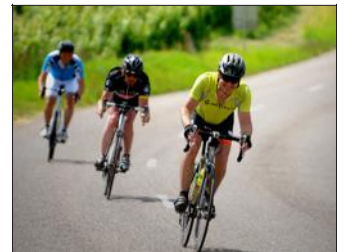
Après l'annulation de l'édition 2020, la Cyclomontagnarde fait son retour en 2021.