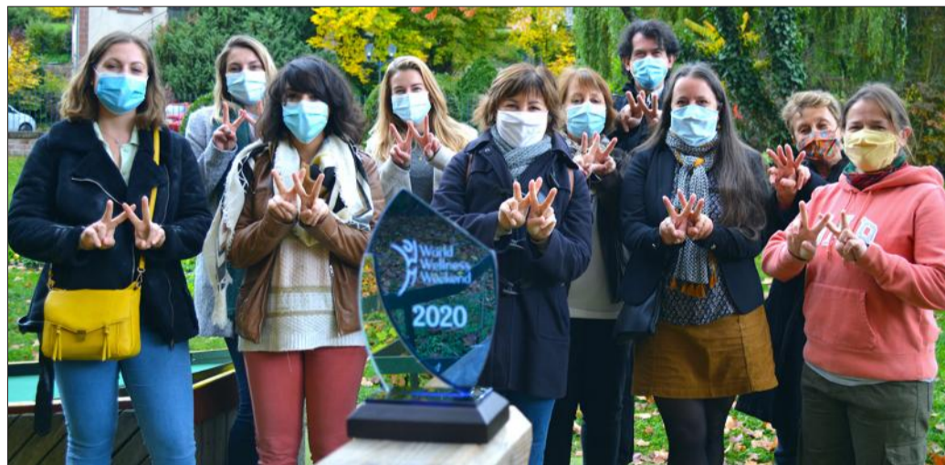
Photo souvenir de l'équipe des organisateurs, avec le trophée, dans le parc du minigolf.

Grâce à sa mobilisation lors du dernier "World Wellness Week-end", Niederbronn-les-Bains a été sacrée au début du mois ville championne du bien-être, devant 542 autres villes dans le monde.